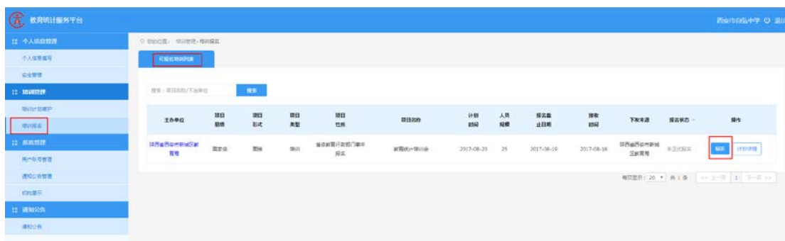
图 2-2 查看可报名信息