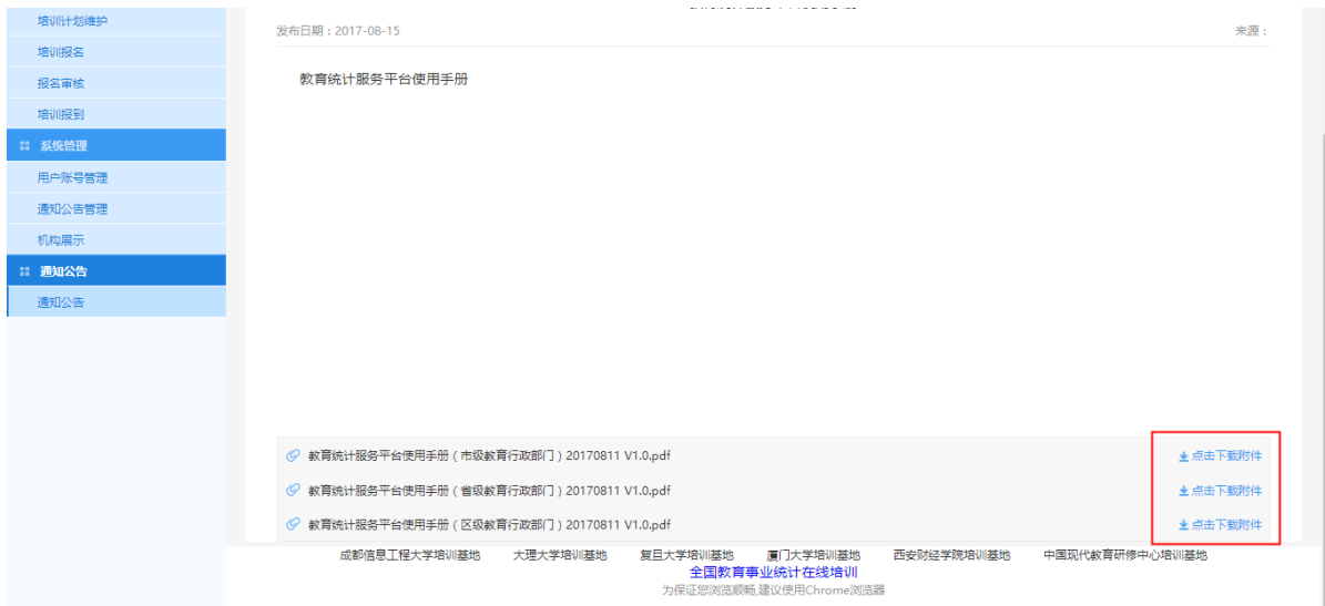
图 1-5 操作手册下载页面