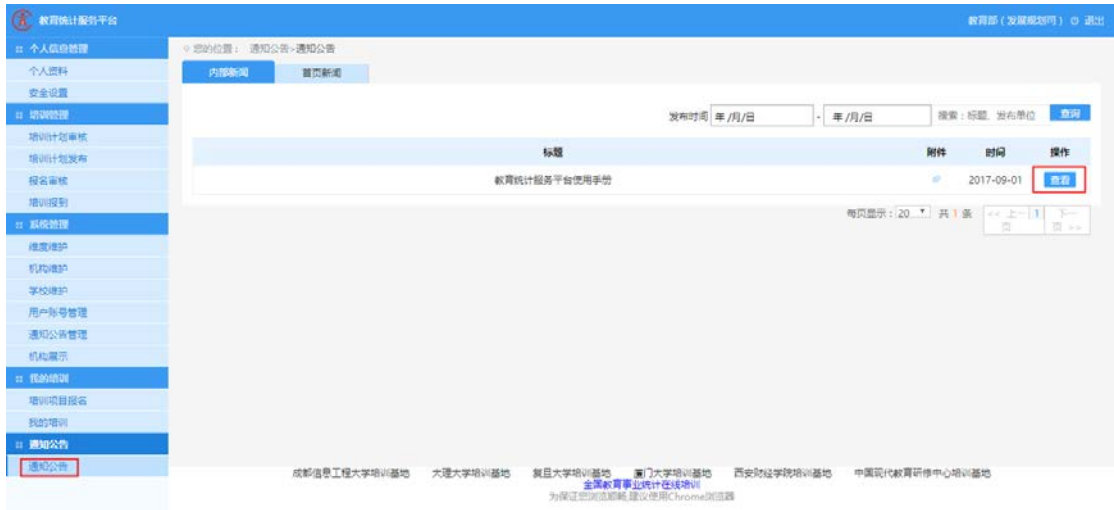
图1-4 查看操作手册页面

点击【通知公告】，根据机构类型( 省级、市级、区县级、学校级 )，下载《教育统计服务平台使用手册》。