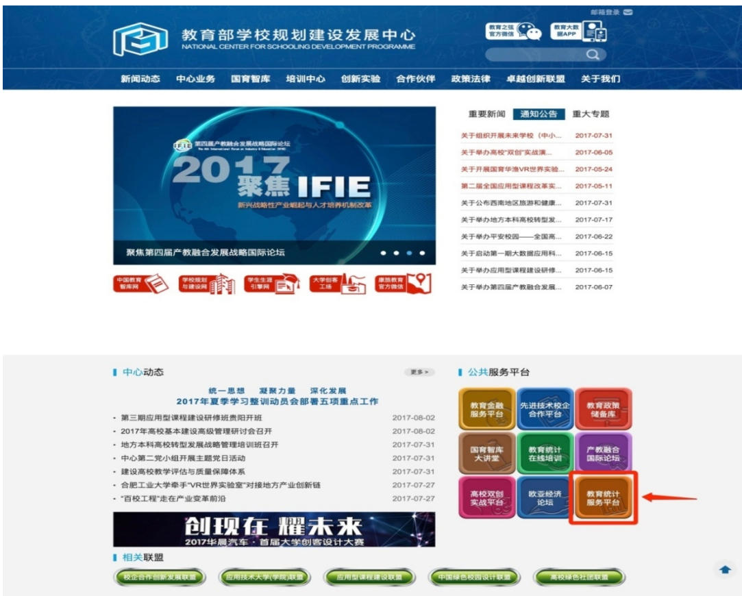
图 1-1 教育统计服务平台登录模块

( 2 ) 登录教育部学校规划建设发展中心官网，网址 http://csdp.edu.cn ，点击首页“公共服务平台”——“教育统计服务平台”模块链接。（如下图所示）