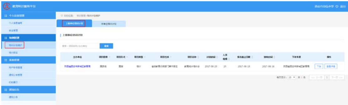
图2-1 查看上级当年培训计划